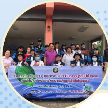
โครงการส่งเสริมความรู้แก่ประชาชนเกี่ยวกับสถานการณ์น้ำในชุมชน ที่ได้รับภัยจากผลกระทบจากน้ำฝนในชุมชน เทศบาลตำบลหนองควาย พ.ศ. ๒๕๖๖ ศูนย์บริการประชาชน เทศบาลตำบลหนองควาย จังหวัดเชียงใหม่